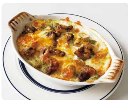
牛すじ肉とスペイン産栗の バジルペンネグラタン ¥1,680