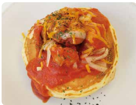
チーズチキントマトパンケーキ