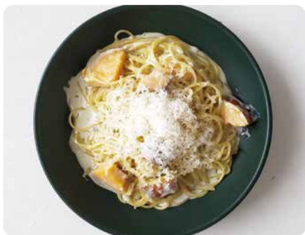
さつまいもとゴルゴンゾーラチーズの クリームソース