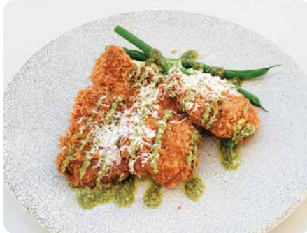
豚ヒレ肉のカツレツ