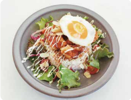
照り焼きチキンオーバーライス