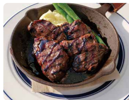
牛ハラミ肉のグリル バルサミソース (ライス付き) ¥1,750