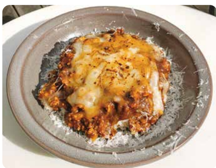
チーズキーマカレー