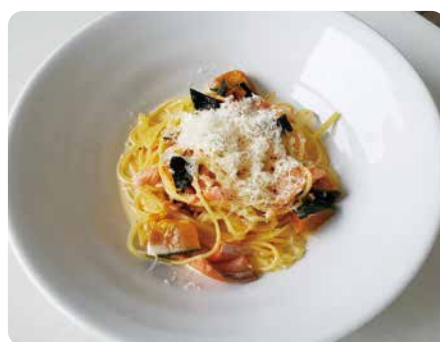
スモークサーモンとかぼちゃの クリームソース ¥1,630