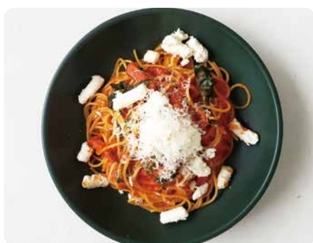
合鴨とほうれん草とリコッタチーズの トマトソース ¥1,530