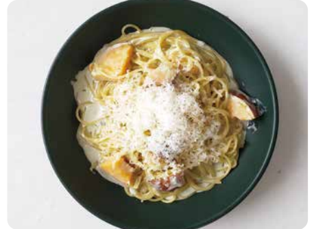
さつまいもとゴルゴンゾーラチーズの クリームソース ¥1,550