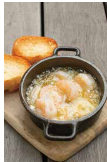
海老のアヒージョ