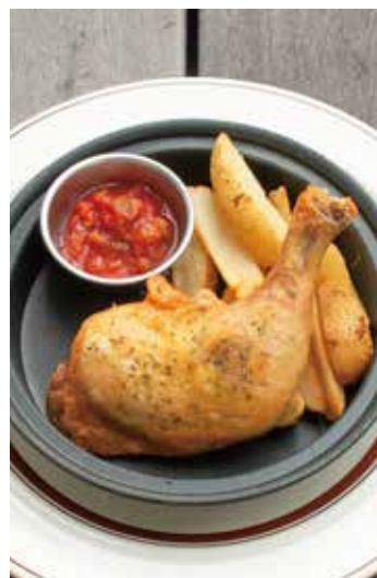
ロティサリーチキン