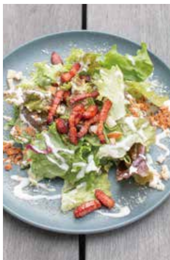
カリカリベーコンの