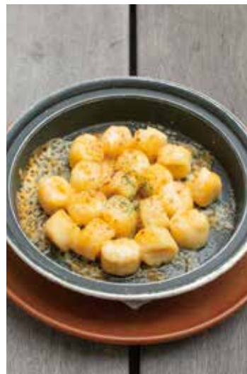
じゃがいものニョッキ