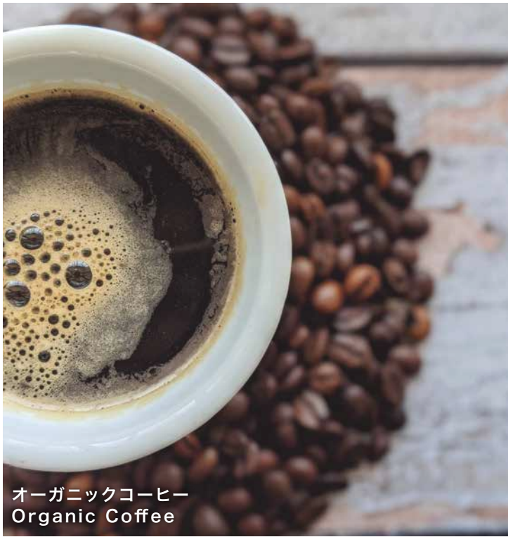
オーガニックコーヒー Organic Coffee