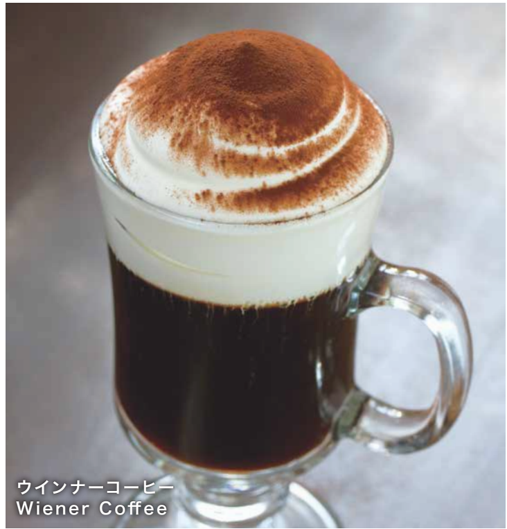
ウイナーコーヒー Wiener Coffee